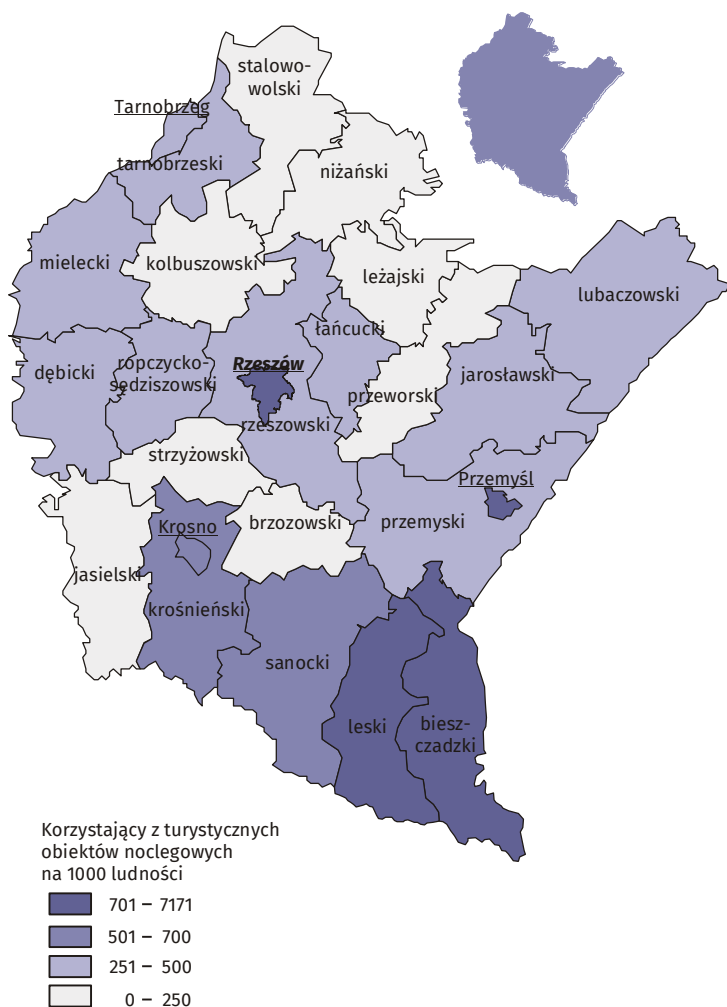
Mapa. Korzystający z turystycznych obiektów noclegowych na 1000 ludności według powiatów w 2017 r.

Bieszczady i Beskid Niski odwiedzają głównie turyści z Polski; w 2017 r. nocowało tam 449,2 tys. turystów, w tym tylko 15,7 tys. turystów zagranicznych (3,5%), ale ich udział w ogólnej liczbie turystów wykazuje tendencję rosnącą. Analogiczny odsetek turystów zagranicznych dla województwa był 4-krotnie wyższy. Region ten charakteryzuje większa sezonowość ruchu turystycznego niż obserwowana dla województwa; o ile w województwie liczba turystów korzystających z noclegów w turystycznych obiektach noclegowych w tzw. wysokim sezonie (lipiec, sierpień) jest 2-krotnie wyższa niż w miesiącach o najniższym stopniu wykorzystania, to w analizowanych powiatach jest 4-krotnie wyższa. Stopień wykorzystania miejsc noclegowych w 2017 r. w regionie był nieco wyższy niż dla województwa ogółem – 39% wobec 35% dla województwa.